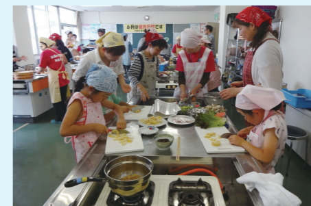
“饮食生活改善推进员”举办的亲子料理教室

长野县距离东京新干线1个半小时的距离,在长野县的周边也有许多著名的观光胜地,比如草津温泉、白川乡、飞弹高山、金泽等等。想要体会日本独特的魅力,同时身心又得到放松的时候,请一定要来健康长寿的长野县。我们在长野县等着各位中国朋友的到来。