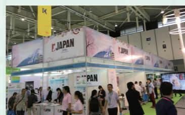
2016 南京老年产业暨康复福祉博览会日本展位 ~帮助企业寻找合作伙伴,代理店等~

具体活动内容包括与中国各地方政府(特别是民政部门)以及相关团体协会携手召开“中日老龄产业交流会”(研讨会、洽谈会、组团参展等形式),与各地方政府联手邀请希望和日企业合作的中方企业进行个别洽谈等等。