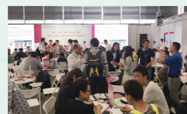
2016 中日(上海市)老龄产业交流会(洽谈会) @ 中国国际养老及康复医疗展(ChinaAid) ~一对一形式的商务洽谈~