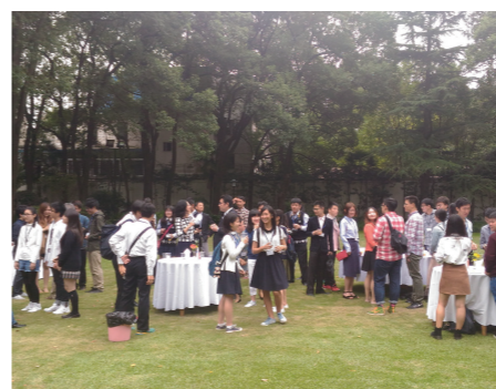
在官邸举办的日中青年 BBQ 交流会

去年,我馆邀请了上海各高校和高中阶段学习日语的中国学生,以及上海日本人学校的学生在官邸举办了 BBQ 交流会。学生们在品尝美味料理的同时,积极交流,畅所欲言,现场氛围十分活泼热烈。友好交流的种子在日中两国学生心间播种、发芽。