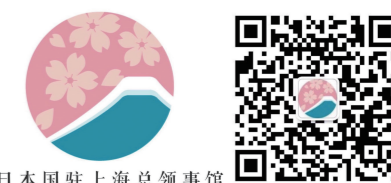
日本国驻上海总领事馆

日本国驻上海总领事馆的官方微信正式开通啦!我们会通过这个平台,发布日本文化、旅游、留学等各类资讯,以及大家关心的赴日签证申请手续等信息。还没有关注我们的朋友,马上拿起手机扫一扫下方二维码,获取最新信息吧!