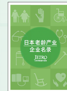
《日本老龄产业企业名录》 ~收录了日本从事老龄产业的企业信息,促进中日企业间的合作~

对于中国政府提出的重视海味老龄和老年人护理的方针,中国企业积极响应,但是很多企业并没有护理行业经验,迫切需要与经验丰富的日本企业合作改善管理以及人才培养等软件方面的不足。很多中方企业参加了我机构组织的交流会,经由我机构驻中国的各事务所也寻找到了合作伙伴。对于中方企业的旺盛需求,去年我机构制作发行了《日本老龄产业企业名录》,可以随时为中日企业提供合作的机会。