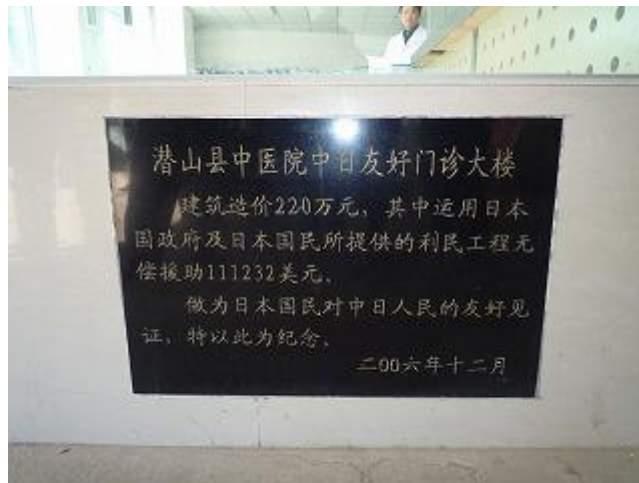
草の根無償資金協力の記念碑