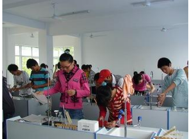
センター内の様子