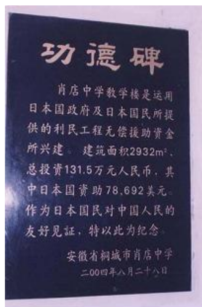
草の根無償資金協力記念碑