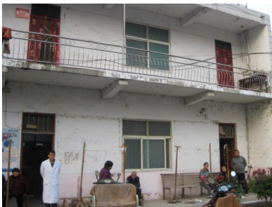
老朽化した衛生室