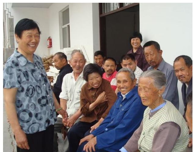
支援後の院長と入居中の老人たち