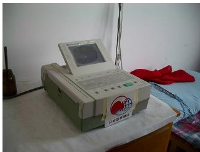
支援した医療器材