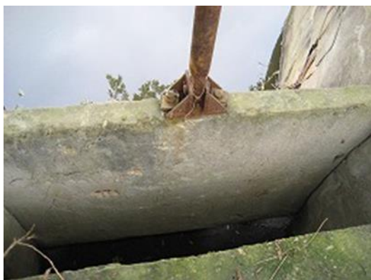
老朽化した調節水門