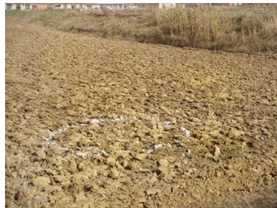
集水井の建設予定地