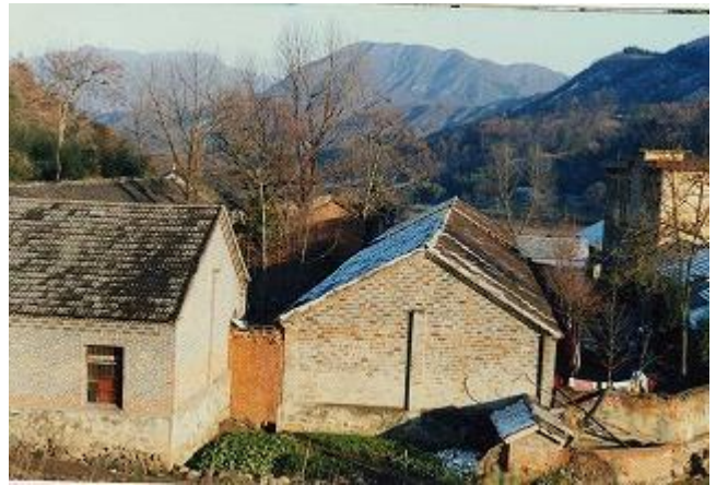
支援前の中学校全景