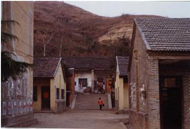
支援前の教室、宿舎