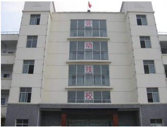
労働職業技術トレーニングセンター教学棟