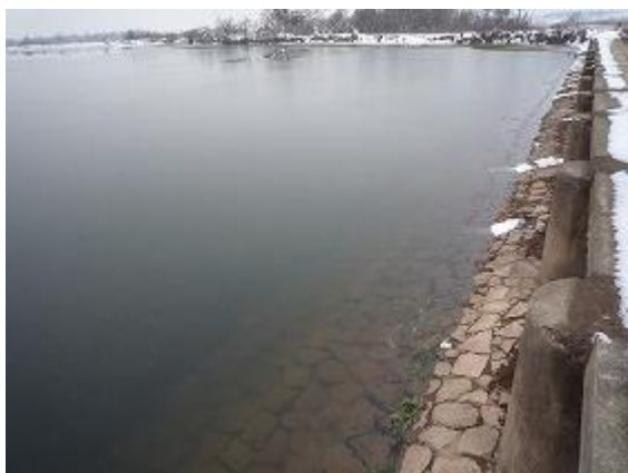
余水路(貯水池側:底面に土砂が堆積)