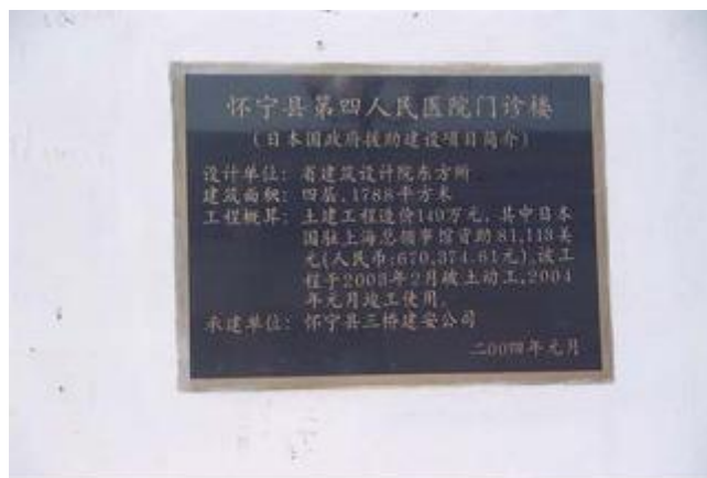
草の根無償資金協力記念碑