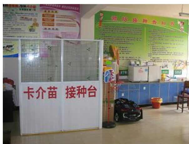
1階児童ワクチン接種室