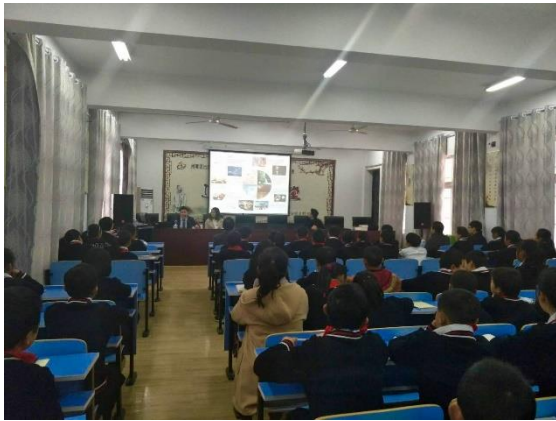
草の根の支援をきっかけとして当館が同校で実施した日本文化紹介講座 (2018年1月18日撮影)