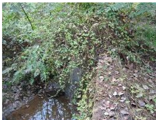
洪水で破壊された土手