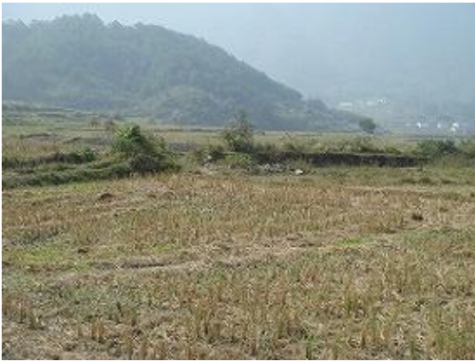
洪水による水害を受けた田畑 1