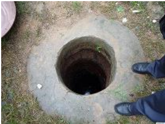
住宅地に掘られた井戸