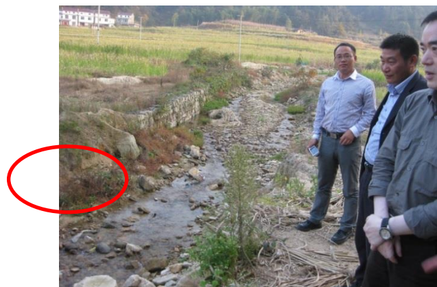
水災害で一部が崩壊したダム(護岸)