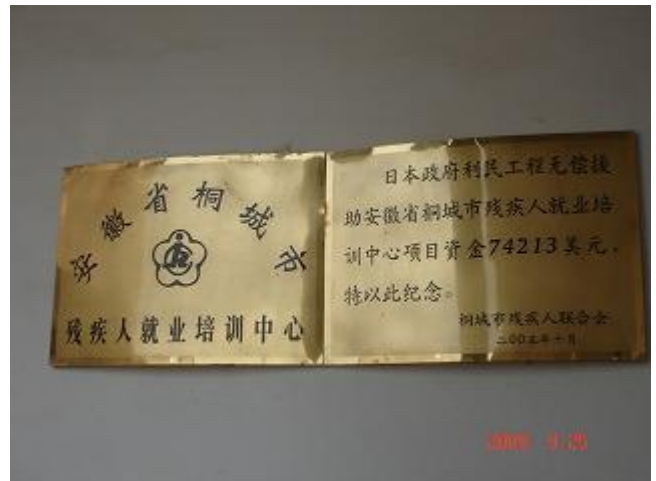
草の根無償資金協力の記念プレート