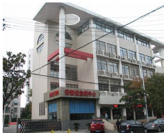
安徽省救急センター