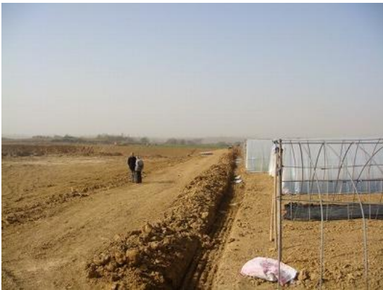
干ばつ被害を受けた耕地