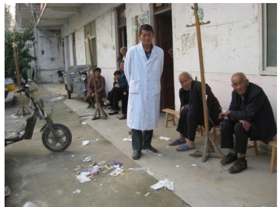
屋外で点滴を受ける患者