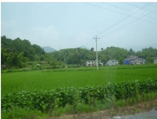
支援後のダム下流 1