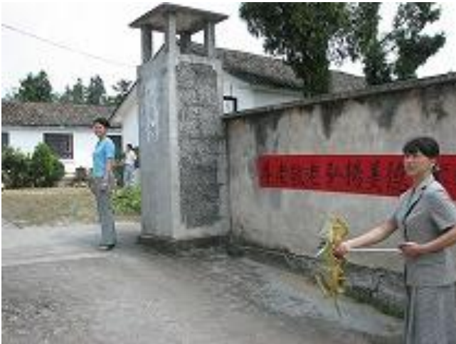
支援前の敬老院外観