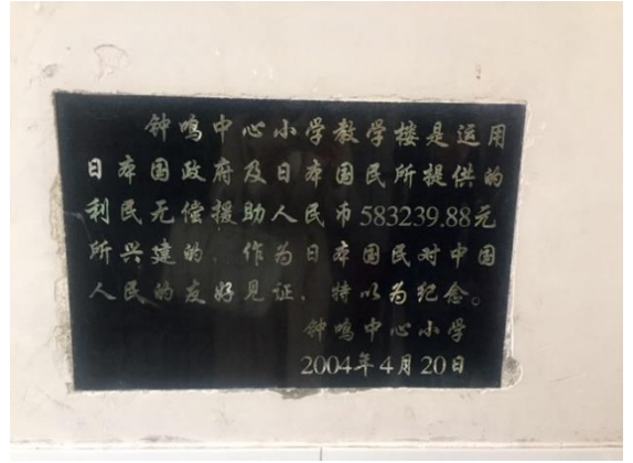
ODA プレート (2018年1月18日撮影)