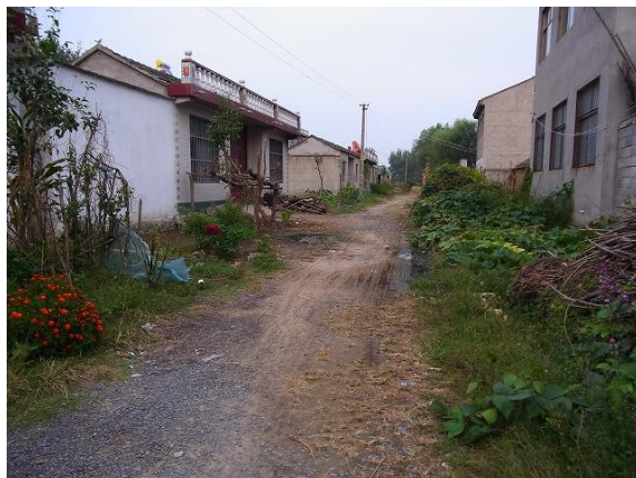
農村道沿いに立ち並ぶ民家