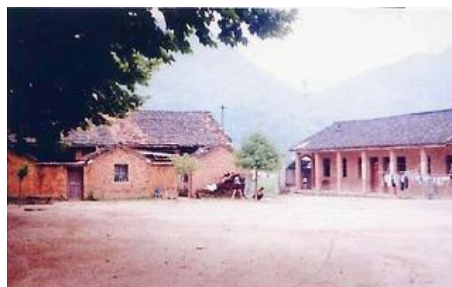
两幢房屋建于七十年代初, 经泾县房管处鉴定为C级危房, 应停止使用