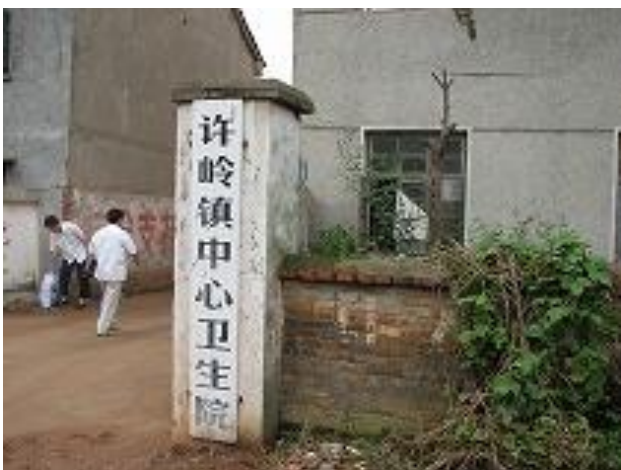
支援前の衛生院入り口