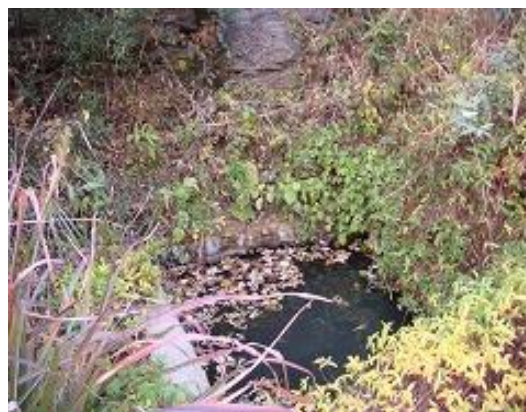
現在使用中の貯水池(2)