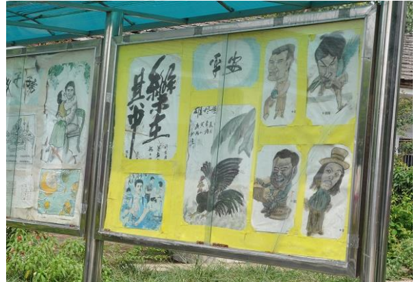
学生達の作品 書道や絵画など