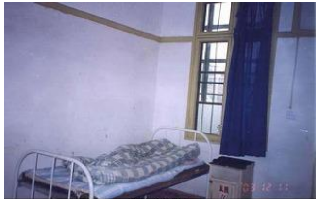
旧肢体矯正部 旧肢体矯正部