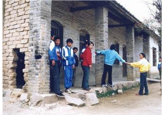
教室断垣残壁，墙体受风雨侵蚀，屋面漏雨