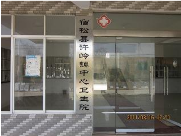
支援後の衛生院入口