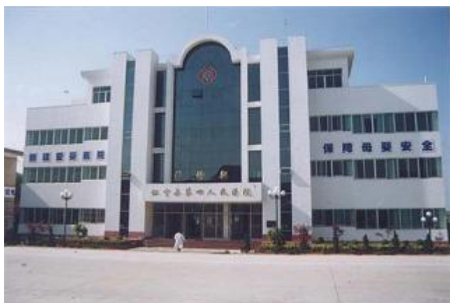
新門診樓 新問診棟