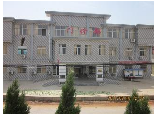
支援後の診察病棟