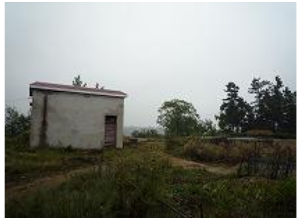
1996年に設置した井戸と浄化槽