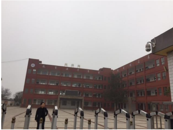
草の根の支援により建設された校舎(左手)とその後 増築された校舎(右手) (2018年1月18日撮影)