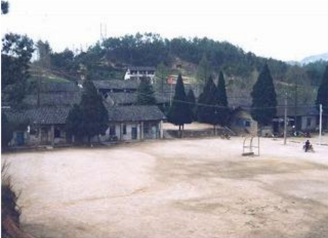
校舍为土木结构，是 70 年代群众献工献料而建。