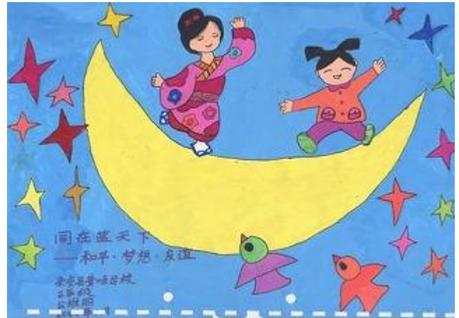
学生寄来的繪画作品