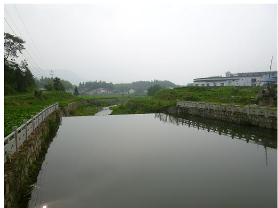
支援後のダム下流 2