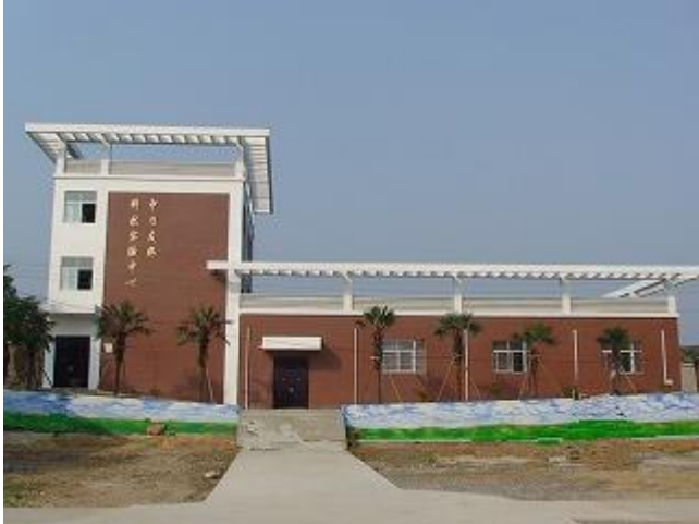
支援した実験センター