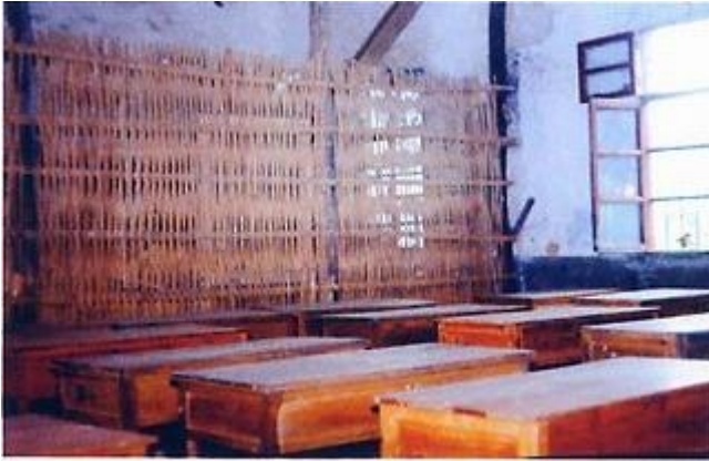
旧教室(四十余人挤在 36 平方米的教室内,拥挤不堪)