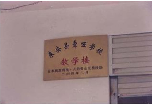
草の根無償資金協力の記念プレート