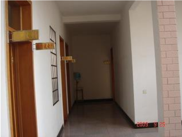
支援したトレーニングセンター内の様子