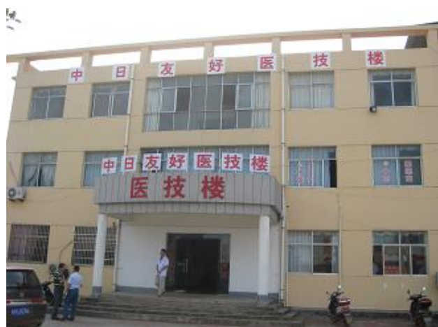
中日友好医技術楼