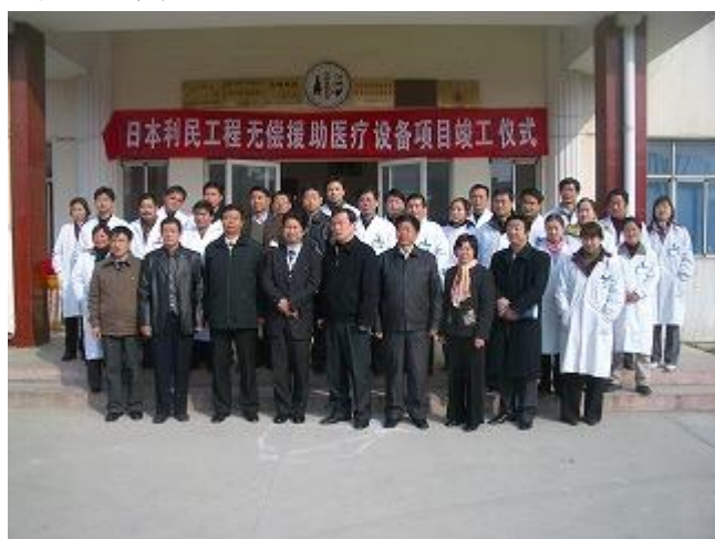
医療器材引渡し式