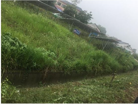
農業用水路の泥除去及びセメント強化