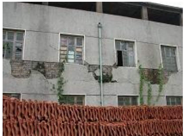
支援前の診察病棟