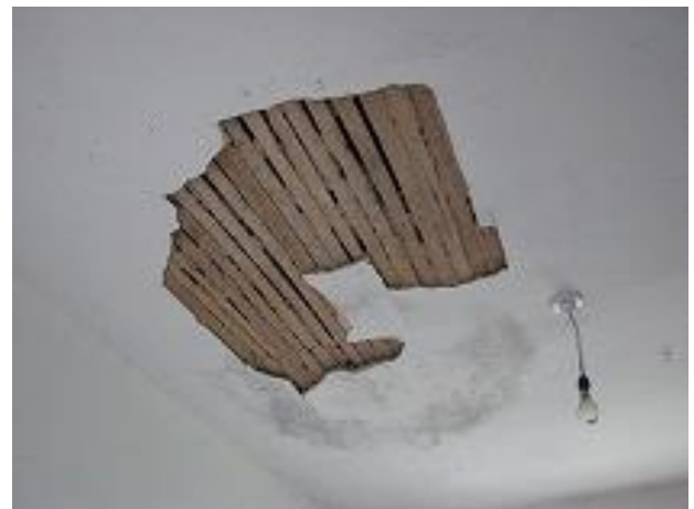
支援前の居住棟内部の様子