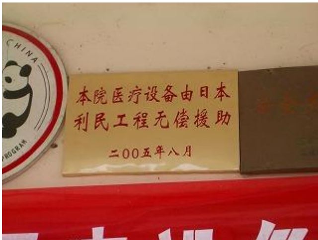
草の根無償資金協力の記念プレート