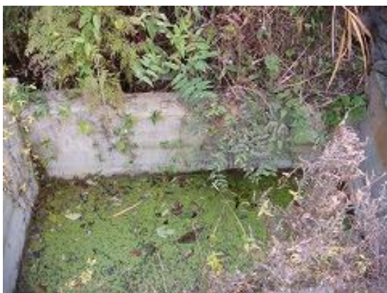
現在使用中の貯水池(1)