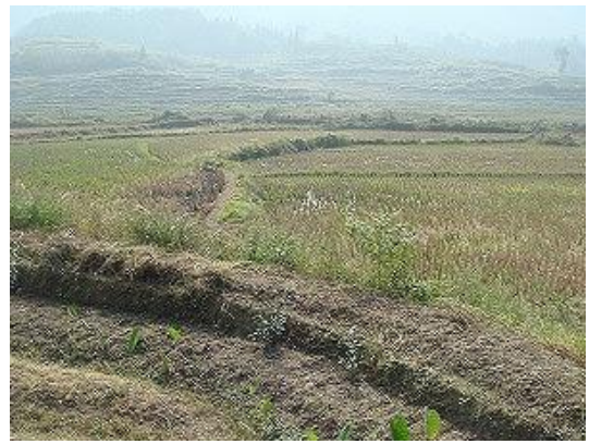
水による水害を受けた田畑 2 (手前が洪水により破壊された堤防跡)