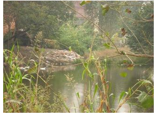
池に捨てられたゴミ