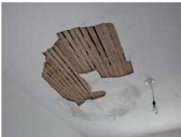
临时使用中的敬老院宿住房内部