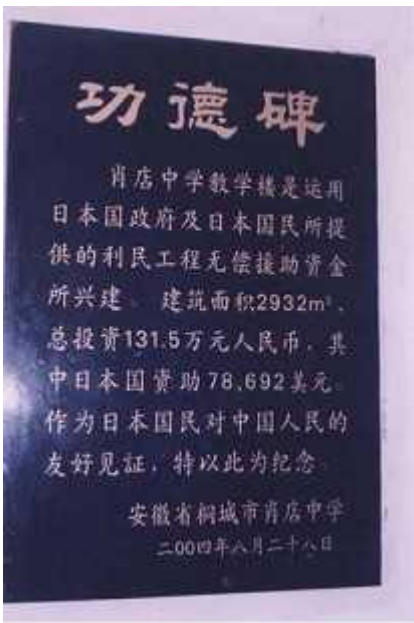
利民工程无偿资金援助纪念碑