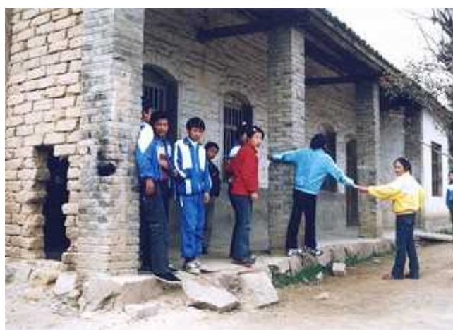
教室断垣残壁、墙体受风雨侵蚀、屋面漏雨