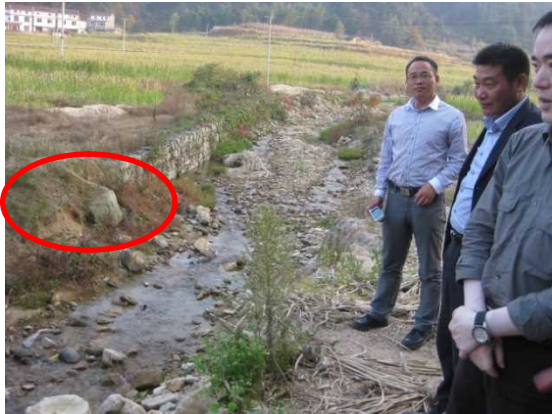
受洪水灾害破坏的护岸