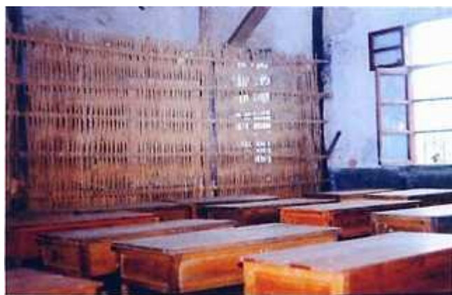
旧教室（四十余人挤在36平米的教室内上课）