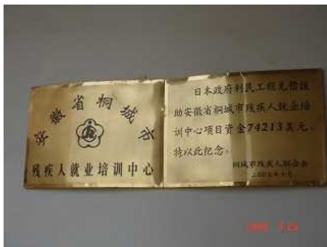
利民工程无偿资金援助的纪念牌