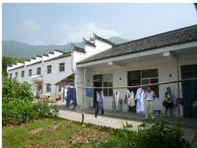
新建的敬老院外观