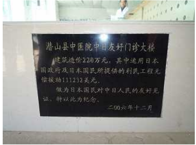
利民工程无偿资金援助纪念碑