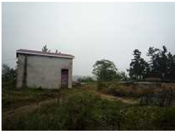
1996 年设置的水井和净化槽

受赠单位:安徽省黄山区人民政府外事办公室 赠款金额:87,434 美元 合同签订日期:2010 年 3 月 18 日