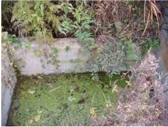
现在使用中的蓄水池（1）