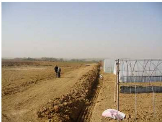
遭受干旱影响的耕地