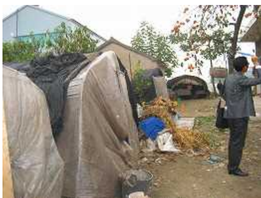
项目实施前的村内情景