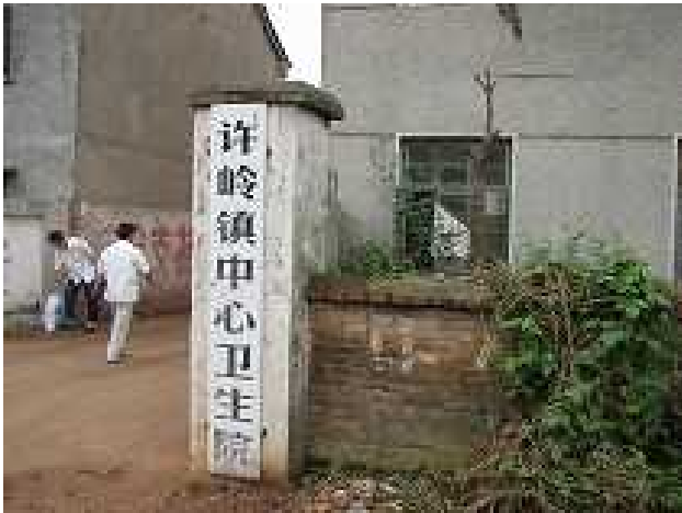
援助前的卫生院的入口