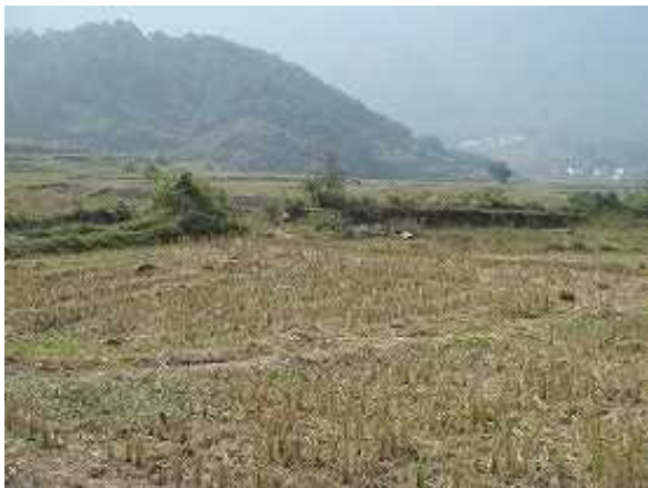
由于洪水受灾的农田 1