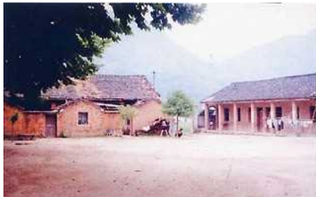
两幢房屋建于七十年代初，经泾县房管处鉴定为C级危房，已无法使用