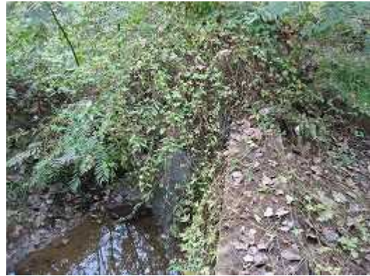
被洪水冲毁的滚水坝