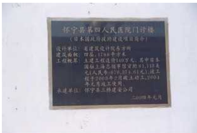
利民工程无偿资金援助纪念碑