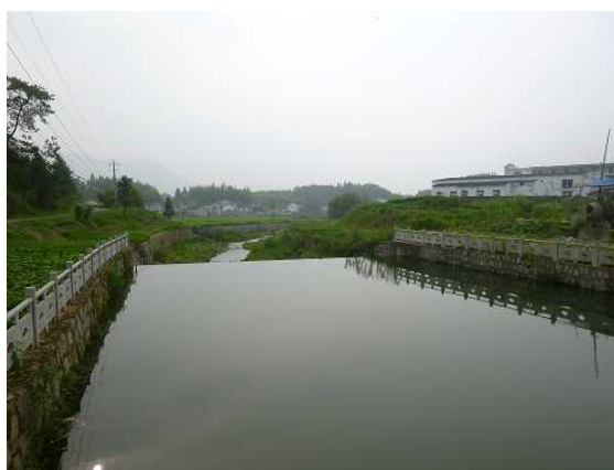
项目实施后的水库下游 2