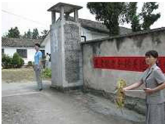
临时使用中的敬老院外观