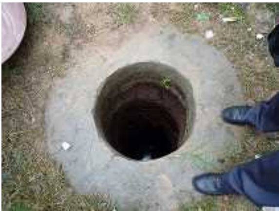
在住宅地挖的水井

狮子岗乡的年平均降水量只有 800 毫米，该地区居民的饮用水源 2/3 来自井水，1/3 来自雨水蓄水池。水中铁、锰、钙和细菌的含量均超标，水质不符合卫生标准。当地有 1/3 人的安全饮水得不到保障。周边 5,500 名居民长期引用上述不卫生的水，23% 以上的居民罹患有传染病和肠胃炎，严重损害着健康。利用利民工程无偿援助的资金，从水库的给水站牵引自来水管道的引水，可提高项目周边地区自来水管道的普及率至 95% 以上，不仅可确保该地区约 5,500 居民、500 头家畜以及邻近居民 4,000 人的安全饮水，也将减少由于摄取不卫生的水源的发病率。