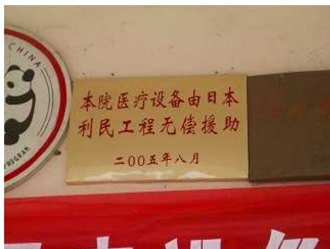
利民工程无偿资金援助纪念碑