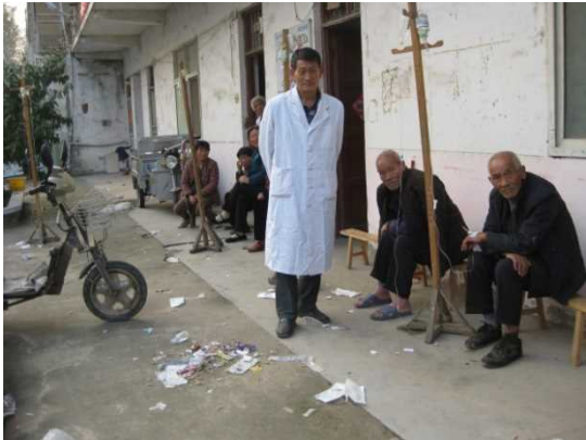
在屋外打点滴的患者