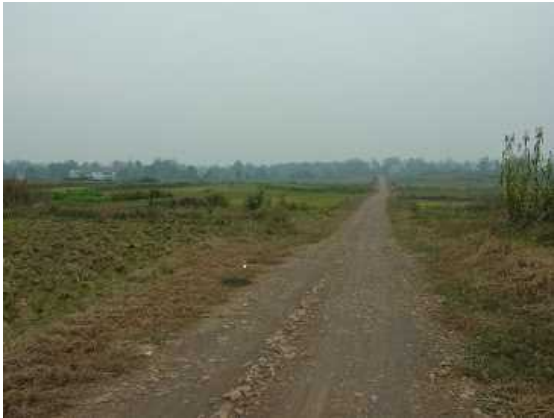
援助前的泥土道路