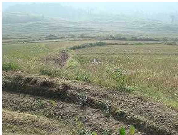
由于洪水受灾地的农田 2 (跟前的是洪水破坏留下的防堤痕迹)