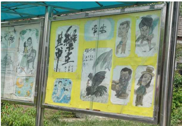
学生们的作品(书法,绘画等)