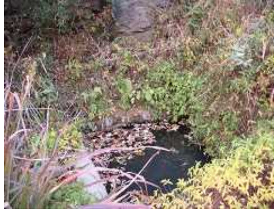
现在使用中的蓄水池（2）