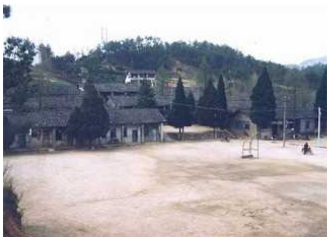
七十年代建的土木结构旧校舍， 由群众献工献料而建