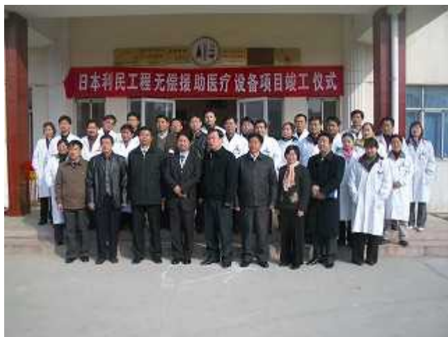
医疗器材的递交仪式