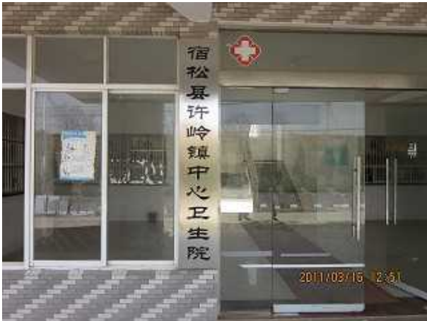
新建的门诊楼门口