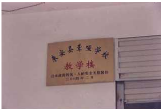
利民工程无偿资金援助纪念牌