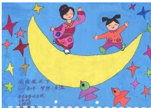
学生寄来的绘画作品