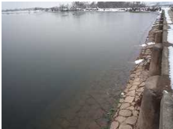
余水路（贮水池一侧：底部砂土堆积）