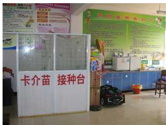
一楼儿童疫苗接种室