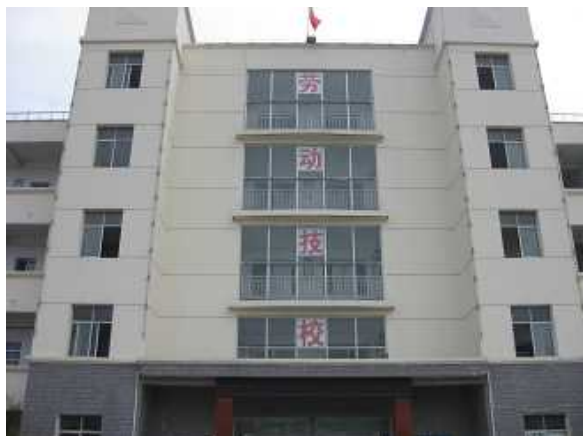
劳动技术培训中心教学楼

新建的劳动职业技术培训中心教学楼(5层、2,004平方米)能同时容纳3,400人听讲,该建设费中的材料费63.36万元由利民工程援助。通过本项目的实施,每年听讲者数将从1,200人左右增加到3,800人,不仅能改善学员的职业技术培训环境,还能促进学员的就业稳定以及收入增加,对学员的家庭以及雇佣当地的企业也大有裨益。