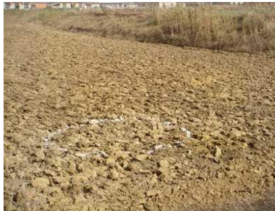
集水井的建设预定地