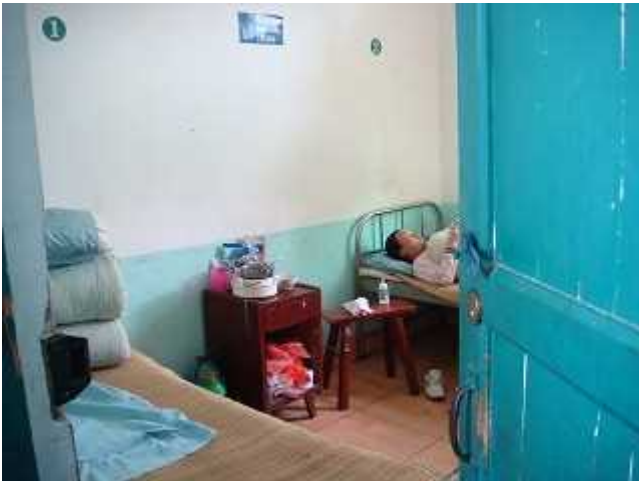
現在の衛生院、病室