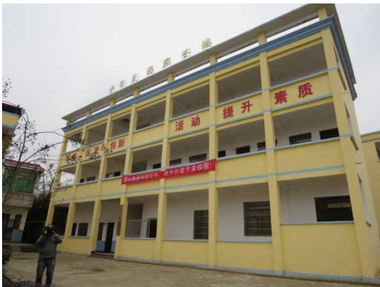
完成した総合棟の全景