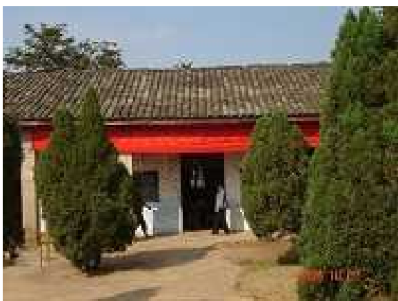
教学棟 (平屋、176 m 2 )