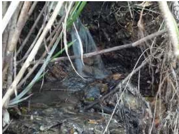
飲料水に適した湧き水（貯水池建設予定地）