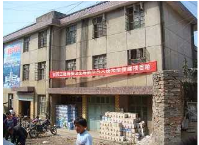
総合棟建設予定地