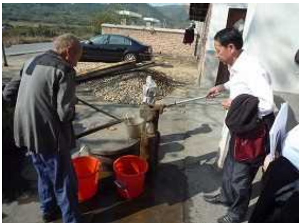
現在使用中の井戸水