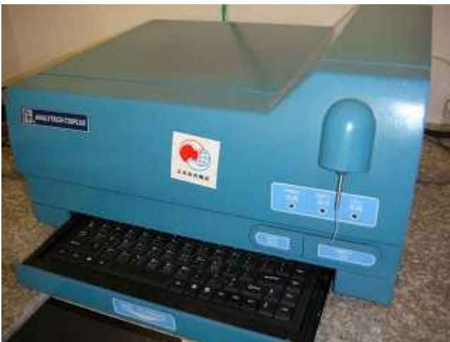
生物化学検査機器