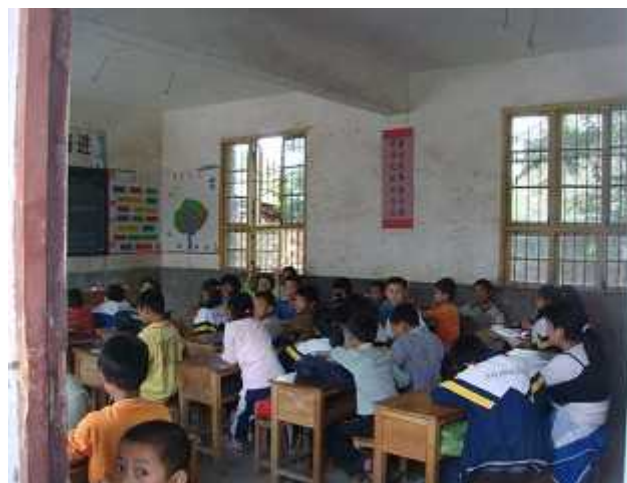
周辺地域の普通小学校