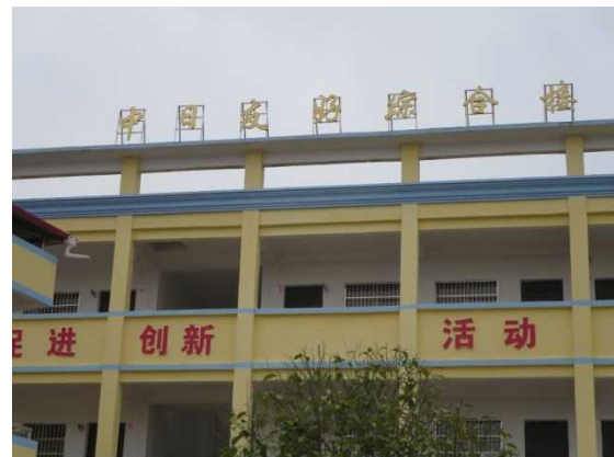
「日中友好総合楼」と書かれている