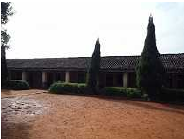
支援前の教学棟（総合棟予定地）