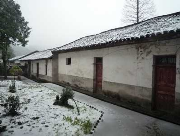
付属棟 2 棟 (総合棟予定地)