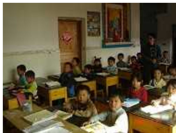
教室 (民家) の内部