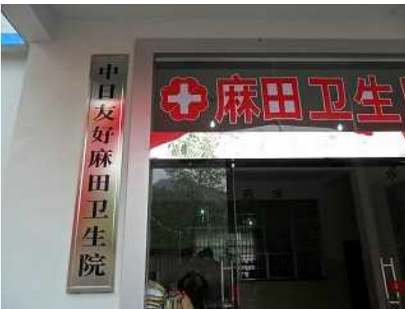
総合楼入り口 (支援後)