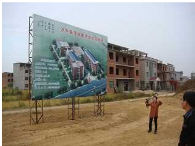
教学棟建設予定地