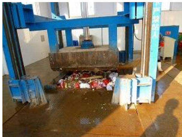
其他村里已建设的同型压缩机