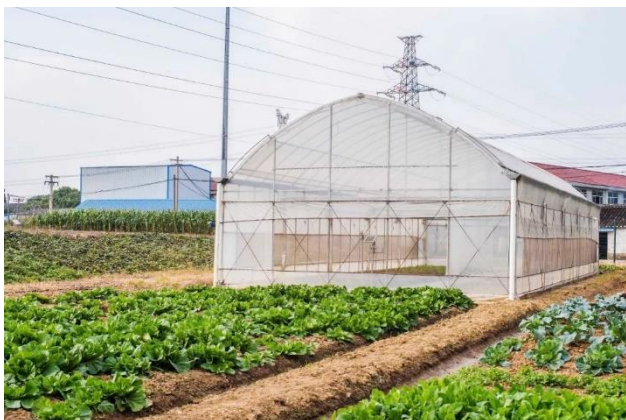
自动化栽培舍外观 (2018年7月5日拍摄)