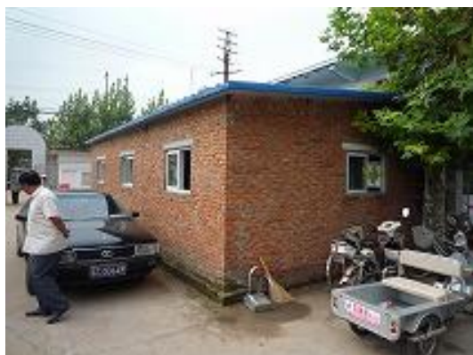
现在替代使用中的门诊楼1 (为确保建设综合楼用地、预定拆除)