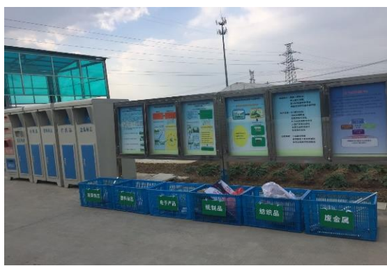
受益团体配套设施