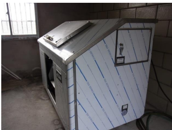
「通过污水处理改善农民生活环境计划」(2010 年度日本 NGO 民间合作无偿资金援助) 设置的转换装置 (将有机废弃物转换成有机肥料的装置)