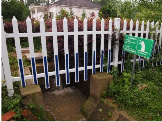
经处理污水排水口 (2018年7月6日拍摄)