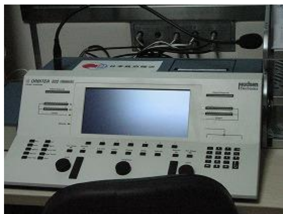
援助的高频听力计