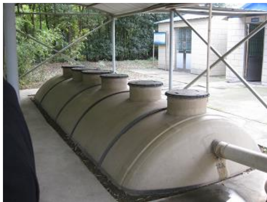
「江苏省无锡市惠山区铁路桥村高度处理型合并净化槽设置项目」(2009 年民生工程) 设置的污水处理净化槽