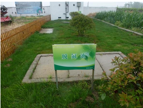
污水处理设备安装后