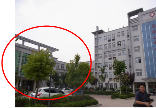
马陵山中心卫生院