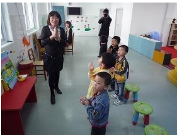
聋哑幼儿正在上课