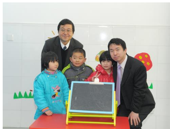
签字仪式前本馆领事与聋哑学生合影