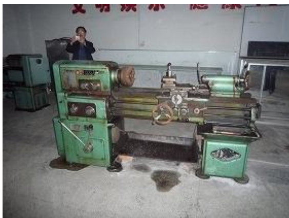
援助前课堂上使用的二手的通用机床