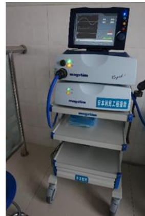
颅磁刺激仪 （2018年9月13日拍摄）