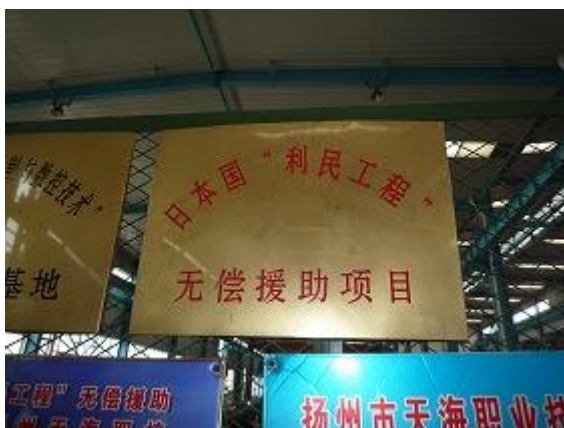
利民工程无偿援助纪念牌