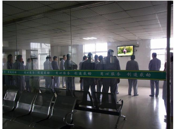
精神病患者（运动中）