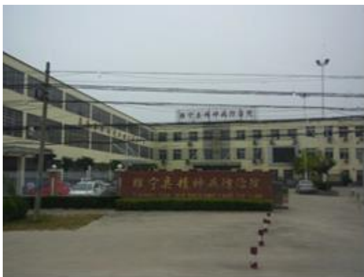
睢宁县高作中心卫生院全景