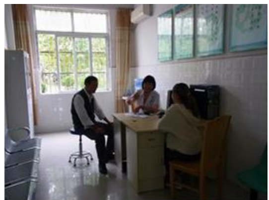
精神病院內门诊室