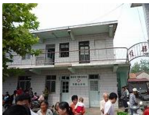
现在替代使用中的门诊楼2 (为确保建设综合楼用地、预定拆除)