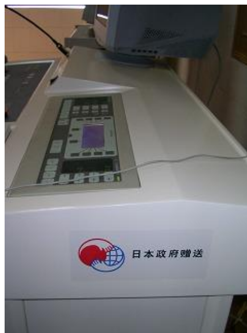
援助的彩超诊断仪