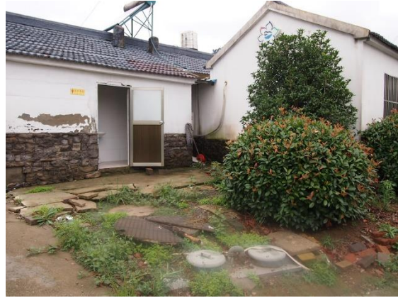
活用于农村厕所的污水处理装置 (2018年7月6日拍摄)