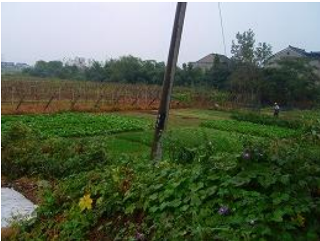
污水处理设施建设地点 （图片中央的种田改为建设）