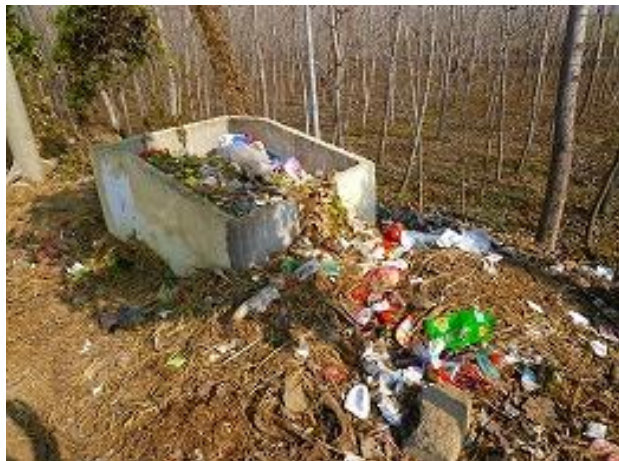
村里现有的堆放点