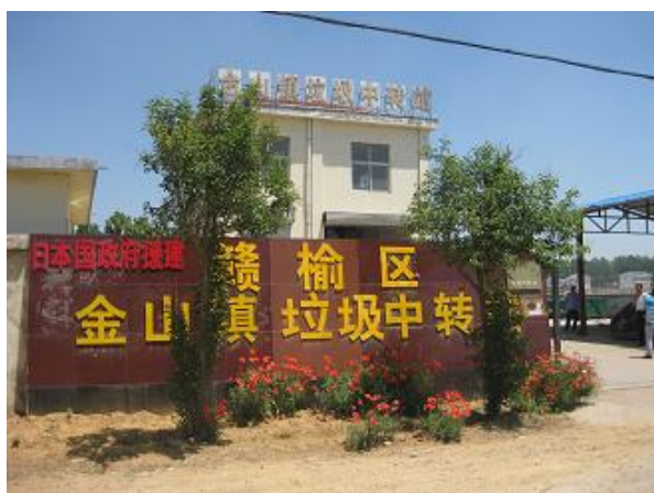
进行垃圾压缩·转运的垃圾中转站 (2016年5月拍摄)