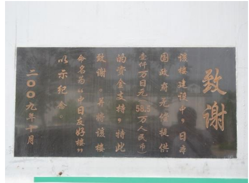
ODA纪念牌（设置在预防楼入口处）