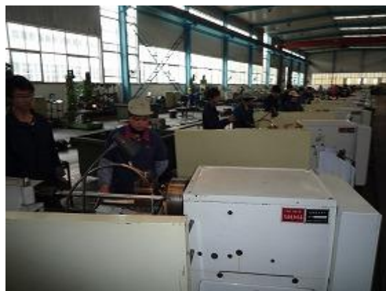
利民工程援助的通用机床