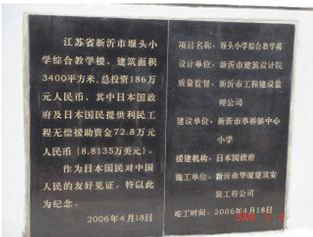
利民工程无偿资金援助纪念牌