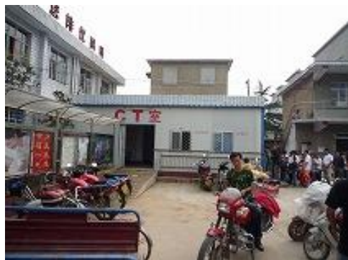
现在替代使用中的门诊楼3 (预定拆除)