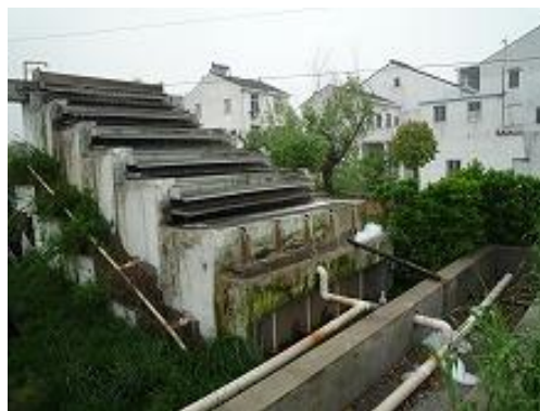
村内的污水处理用酸化槽（磷·氮无法彻底处理）