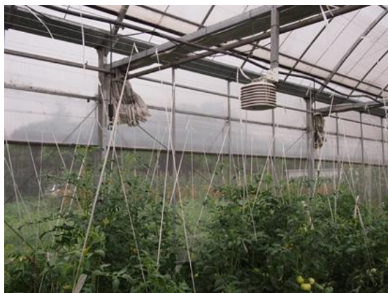
自动化栽培舍内部 (2018年7月5日拍摄)